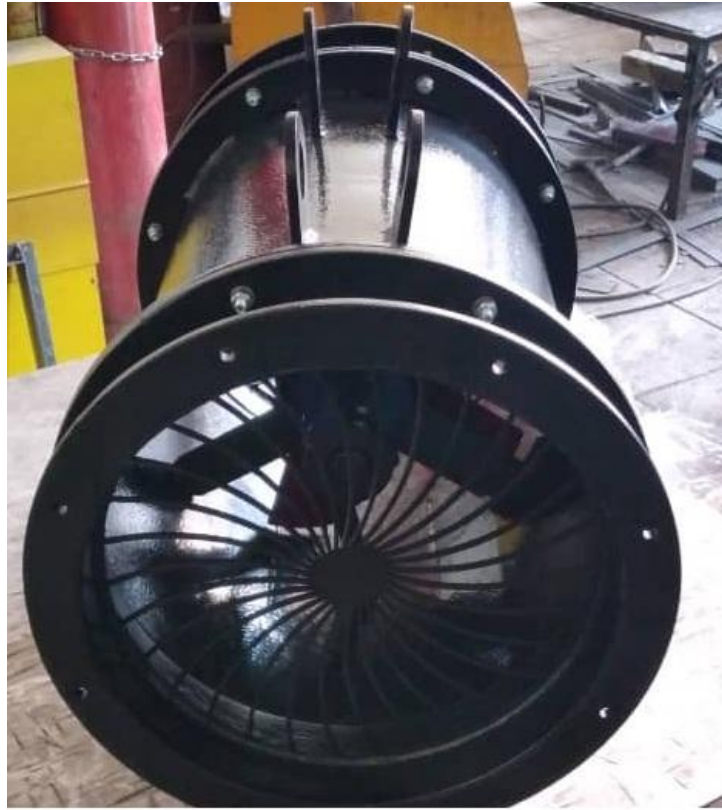
ونتیلاتور بادی معدنی ( هواکش پنوماتیک معدنی )