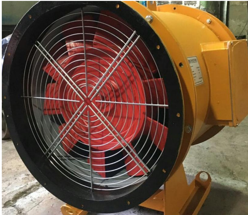
جت فن برقی معدنی ( هواکش برقی معدنی )

جت فن های الکتریکی و پنوماتیکی با سرعت بالا و فشار مناسب ، هوای مورد نیاز بخشهای استخراج و تونلهای ترابری را مهیا می نمایند .