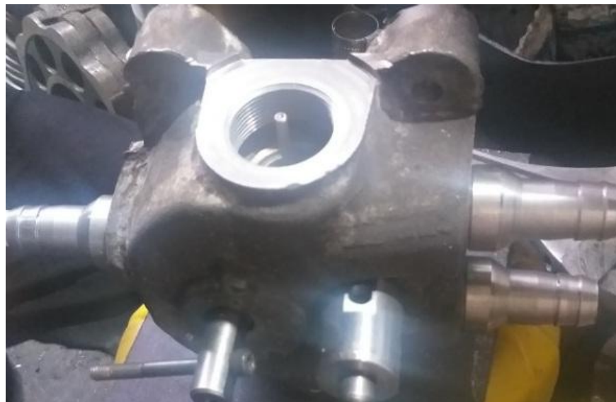
ولو کنترل هوای لودر بادی روسی

جهت کسب اطلاعات بیشتر و خرید با ما تماس بگیرید