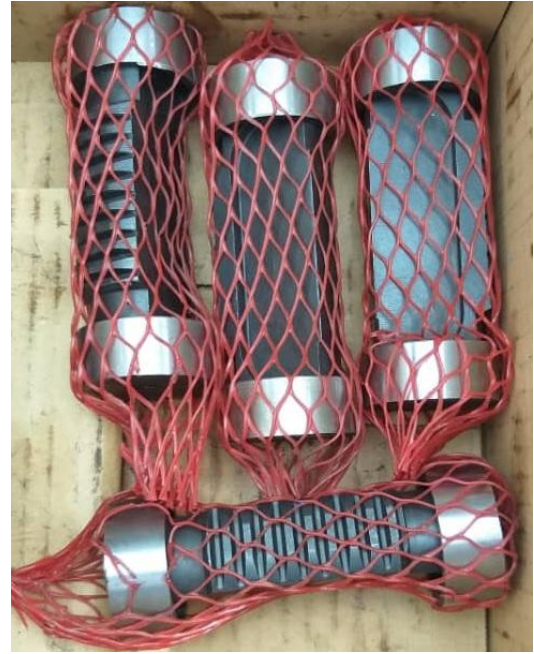
قطعات یدکی اتو لودر