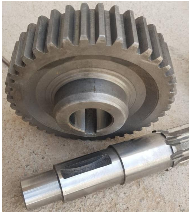
قطعات یدکی گیربکس لودر تونلی